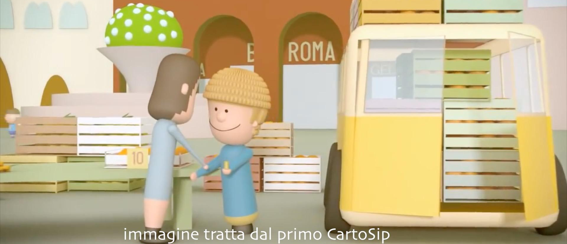
immagine tratta dal primo CartoSip "TRA UN' ARANCIA E L'ALTRA"

INCIDERE DIRETTAMENTE SULLE SORTI DI TANTE VITE