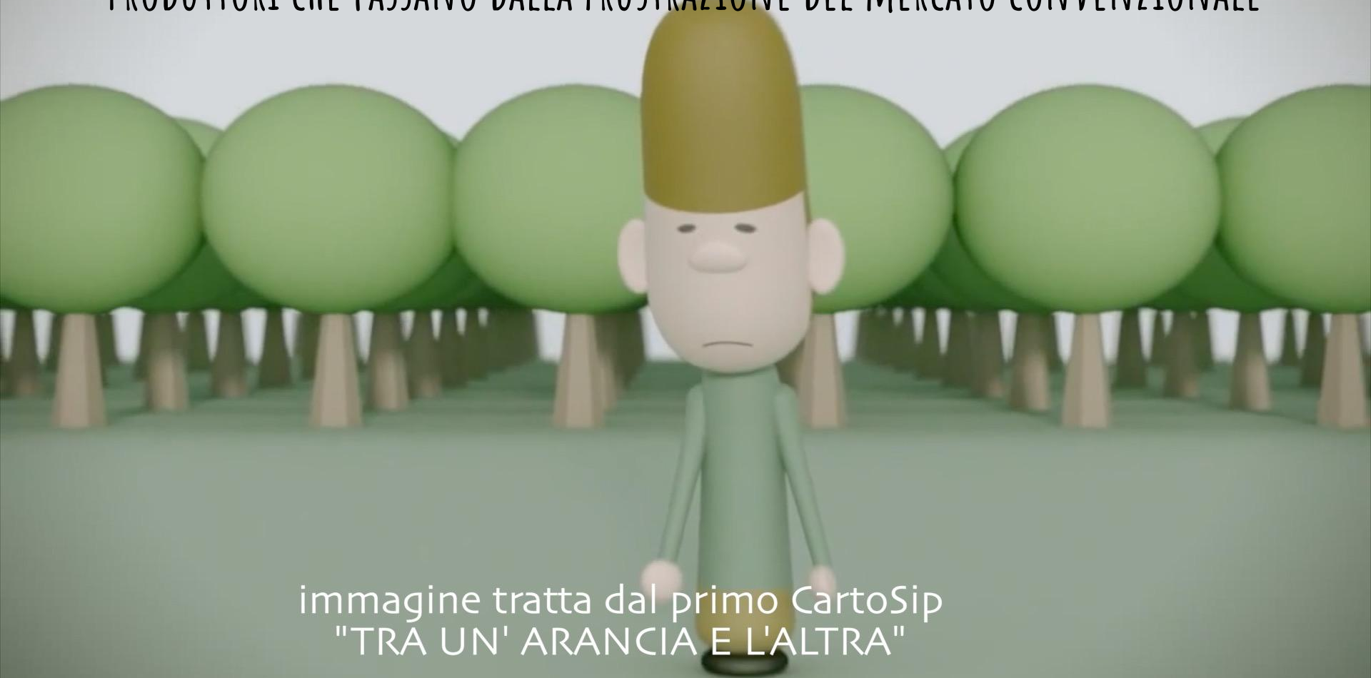
immagine tratta dal primo CartoSip "TRA UN' ARANCIA E L'ALTRA"

PRODUTTORI CHE PASSANO DALLA FRUSTRAZIONE DEL MERCATO CONVENZIONALE