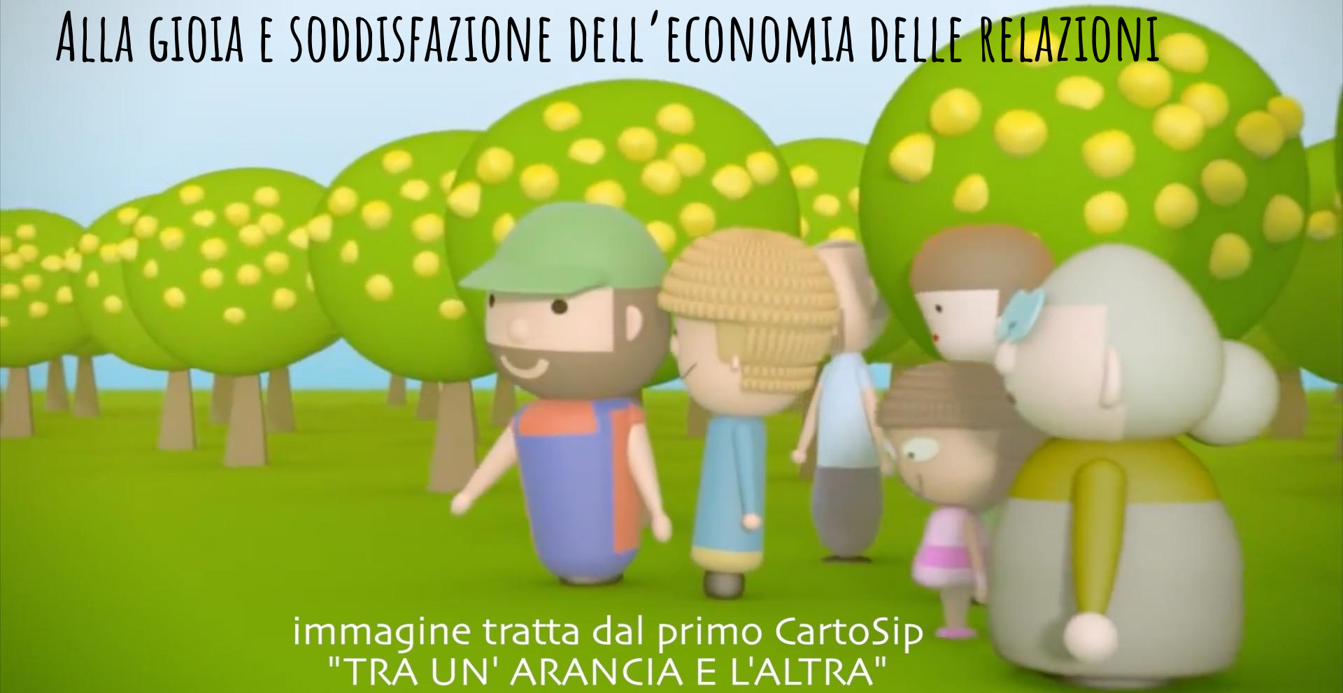
immagine tratta dal primo CartoSip "TRA UN' ARANCIA E L'ALTRA"

ALLA GIOIA E SODDISFAZIONE DELL'ECONOMIA DELLE RELAZIONI